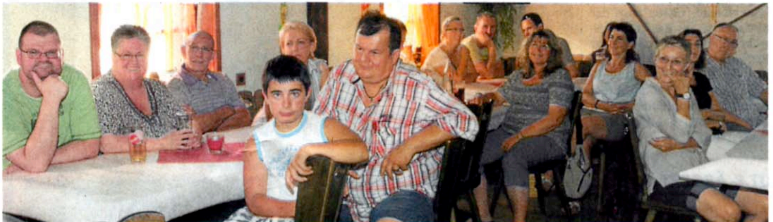
Viele Vierbeiner-Fans interessierten sich für Assmanns Ausführungen zur Hund-Mensch-Beziehung.

Das Buch kann man über die Internetseite www.hundeschule-assmann.de bestellen.